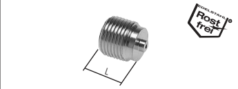
selbstdichtend ohne Sechskant